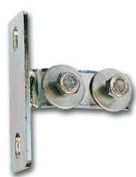
683 8 X01